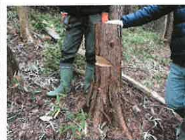
掛木の処理について メンバー間の質問も